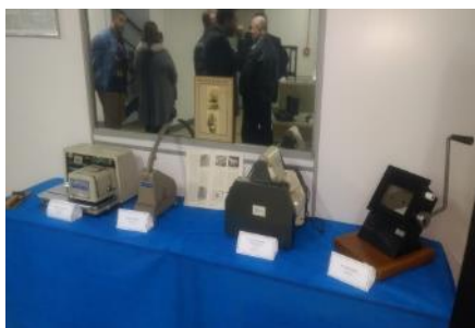
Equipamentos para confecção de Carteiras de Identidade

O aniversário do IGP motivou a organização de uma mostra para recordar a trajetória da Perícia no Estado. Com a participação dos Departamentos, foi montada a exposição de objetos variados, equipamentos, móveis, livros e documentos, que relembram as atividades de perícia no RS desde o início do século passado. Tudo isso no saguão do 3º andar – ala norte, do prédio da Secretaria Estadual da Segurança Pública.