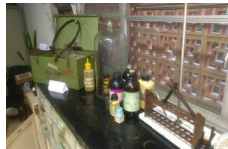
Móveis e materiais do Laboratório de Metalografia antigo DC